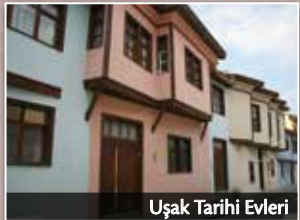
Uşak Tarihi Evleri