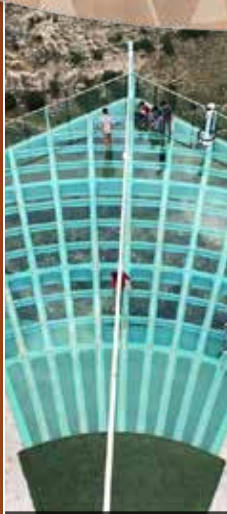
Ulubey Kanyonu Cam Teras