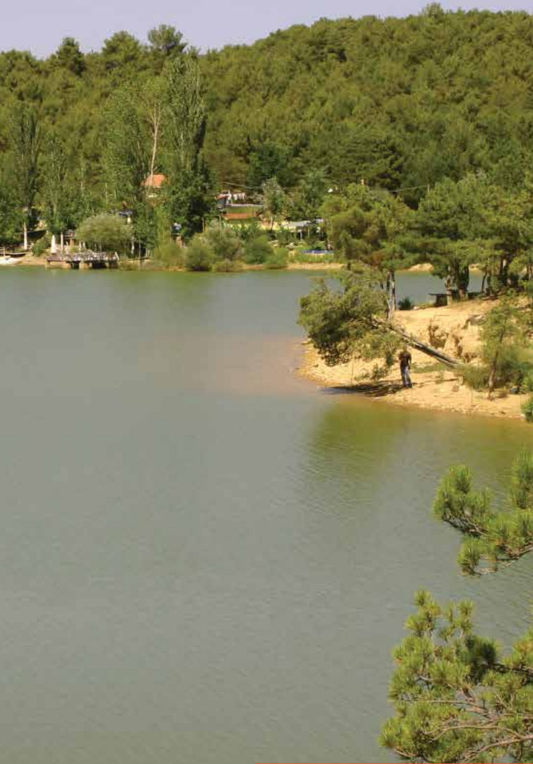
Göğem Köyü Gölleti ve Çamlığı