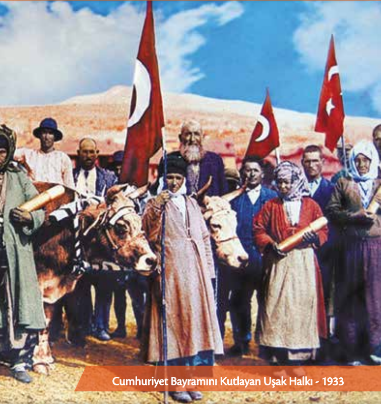
Cumhuriyet Bayramını Kutlayan Uşak Halkı - 1933