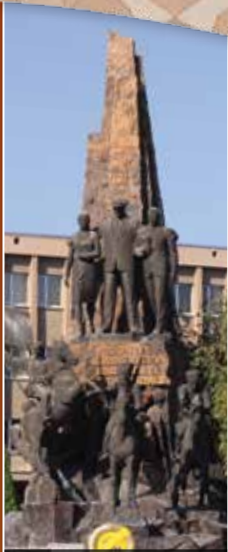
Atatürk Anıtı - Merkez