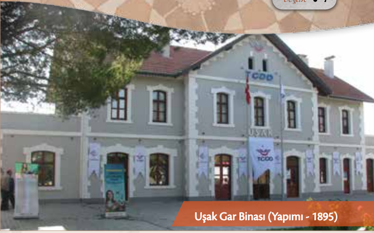
Uşak Gar Binası (Yapımı - 1895)