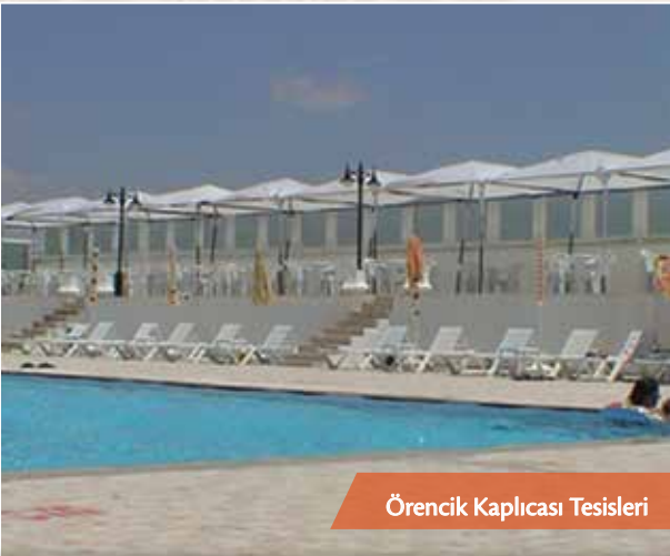
Örencik Kaplıcası Tesisleri