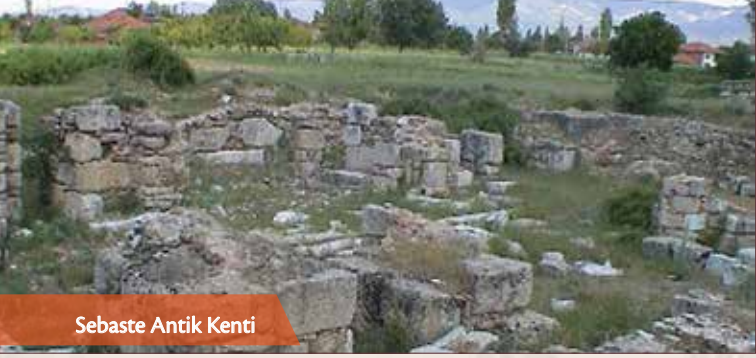
Sebaste Antik Kenti