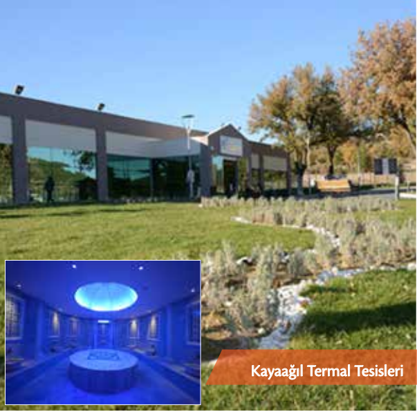
Kayaağıl Termal Tesisleri

Uşak iline 8 km uzaklıkta Kayaağıl Köyü yakınlarındadır. Apart otelleri ve havuzları mevcuttur.