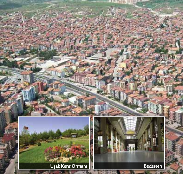
Uşak Kent Ormanı

Uşak'ın tarihsel birikimi Yunan işgali ve Kurtuluş Savaşı ile yoğunlaşır. Sanatsal ve kültürel birikimi ise daha eskilere uzanır. Çok sayıda yetişmiş ilim ve sanat adamı ve bunların ürettiği eserler bakımından zengin bir geçmişe sahiptir. Bu